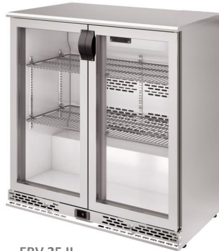
ERV 25 II